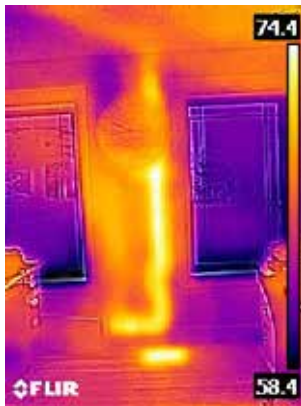
Warmes Abflussrohr in der Wand