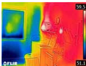
Nicht isolierte Außenwand