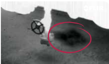
Erfasstes Gasleck an einem Produktionsstandort.

Die FLIR G300 a ist problemlos in Gehäuse mit anwendungsspezifischen Anforderungen integrierbar.